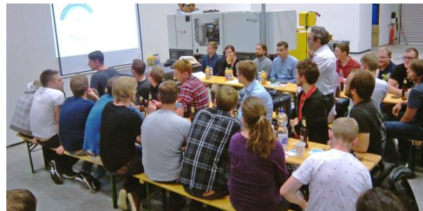
Praktikumsabend des Fachgebiets Kunststofftechnik der TU Ilmenau

Dieses Semester organisierte das Fachgebiet Kunststofftechnik der TU Ilmenau gemeinsam mit dem PolymerMat e.V. einen Praktikumsabend. Am 24. Juni 2015 nutzten ca. 30 Studenten aus dem Bereich Kunststofftechnik die Möglichkeit und informierten sich über aktuelle Praktikumsplätze in fünf thüringischen Unternehmen. Zu Gast waren neben der KHW Kunststoff- und Holzverarbeitungs GmbH aus Geschwenda auch die Arnstädter Werkzeug- und Maschinenbau AG, die Remy & Geiser GmbH aus Hinternah, die Wiegand GmbH aus Schlotheim sowie Argor aus Hörselgau. Die Unternehmer profitieren von dem Angebot an Praktika-Plätzen zum einen vor dem Hintergrund kompetenter zukünftiger Fachkräfte und zum anderen werden junge Menschen durch Praktika früh an das Unternehmen gebunden, wo diese dann gegebenenfalls auch eine studentische Arbeit durchführen. Abgerundet wurde der Abend durch ein geselliges Beisammensein, um den Kontakt zwischen den Mitarbeitern, Studenten oder auch zu den Unternehmen zu intensivieren und sich besser kennenzulernen.